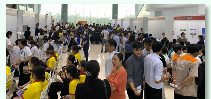
2024年8月、県省主催で開催した人材マッチングイベントの様子