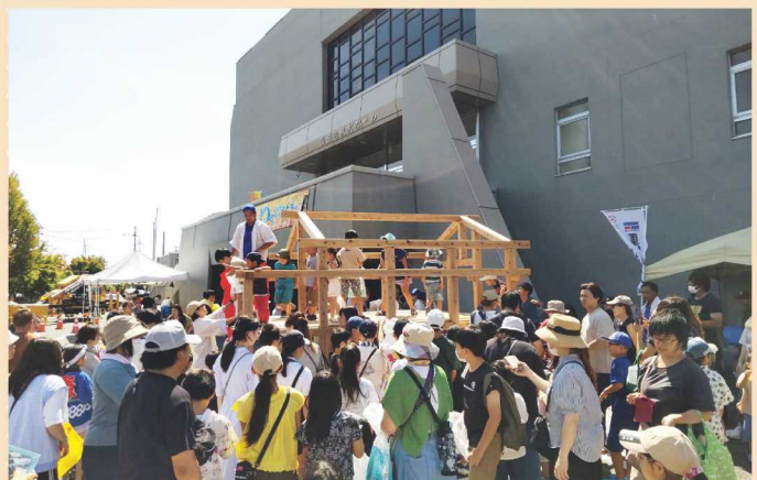
昨年のイベントの様子